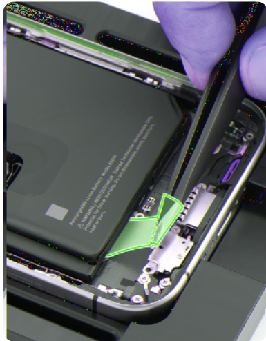
Las baterías del iPhone se fijan con adhesivos avanzados diseñados para sacarlas cuando se manipulan en una dirección específica, lo que permite el reemplazo de la batería.

En Apple, nuestro objetivo es diseñar productos que resistan los rigores del uso diario y, al mismo tiempo, reducir la necesidad de mantenimiento o reparación. Diseñar estratégicamente para poder reparar sin poner en riesgo la durabilidad es un pilar clave de la longevidad del dispositivo. Por ejemplo, para poder reemplazar la batería fácilmente, utilizamos adhesivos avanzados diseñados para fijar de forma robusta las baterías pero que también permiten sacarlas cuando se manipulan en una dirección específica.