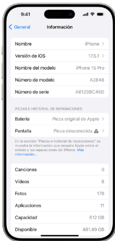
Si el iPhone de un usuario se ha sometido a una reparación, aparecerá una sección Historial de servicio y piezas en los ajustes del iPhone.

Los clientes tienen derecho a transparencia, es decir, a saber si su dispositivo ha sido reparado y si las piezas críticas para la seguridad, la protección o la privacidad están diseñadas por Apple. Por ejemplo, la introducción de un sensor biométrico de otro fabricante podría comprometer la autenticación del usuario o una batería mal fabricada podría poner en peligro la seguridad. Por eso Apple introdujo una prestación denominada Historial de servicio y piezas con nuestro programa de reparaciones de autoservicio. Apple sigue siendo el único fabricante de smartphones que avisa a los clientes si su dispositivo ha sido reparado y si las piezas son fabricadas por Apple.