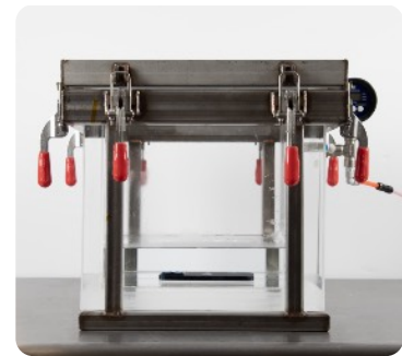
Para probar la protección por inmersión en agua IPX7/8, Apple sumerge el iPhone en un recipiente presurizado para simular la presión que se experimenta bajo el agua.