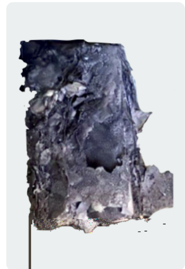
Batería de otro fabricante después de una prueba de sobrecarga abusiva que está destinada a simular la carga de la batería más allá de sus límites previstos.