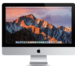
モデル MNDY2J/A, MNE02J/A