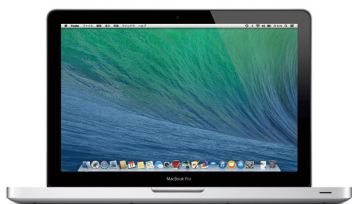
モデル MD101J/A、MD102J/A 発表日 2012年6月11日