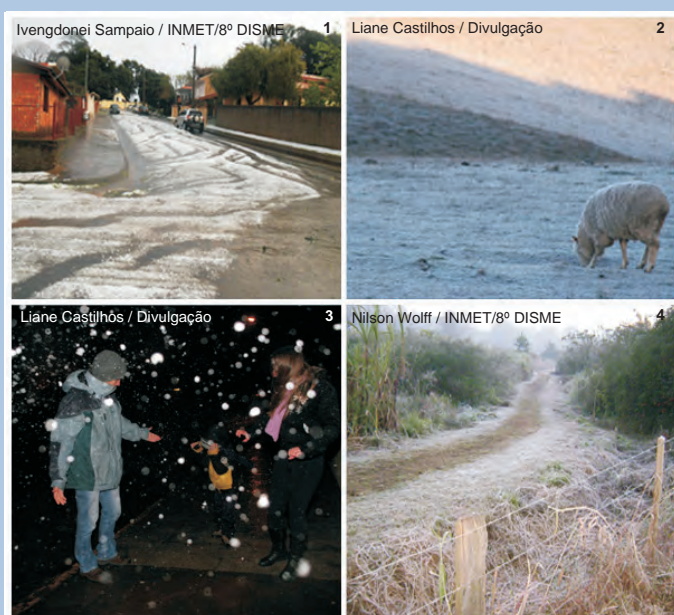
1- Granizo em Passo Fundo - RS; 2- Geadas em Cambará do Sul - RS; 3- Neve em Cambará do Sul - RS; 4- Geadas em Campo Bom - RS

Os meses de julho e agosto de 2011 caracterizaram-se pela ocorrência de fenômenos meteorológicos adversos, com grande frequência, na Região Sul do Brasil. Precipitações intensas, geadas, temperaturas negativas, queda de granizo, rajadas de ventos fortes, precipitações de neve, foram registrados pela densa rede de estações meteorológicas que cobre os estados do Rio Grande do Sul, Santa Catarina e Paraná, conforme descrição feita pelo coordenador do 8º Distrito de Meteorologia, Solismar Damé Prestes.