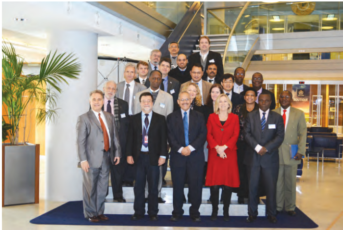
Participantes da Sessão do Conselho Executivo da OMM sobre Desenvolvimento de Capacidades