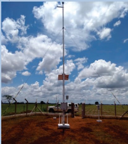
Estação Automática Fátima (MS)