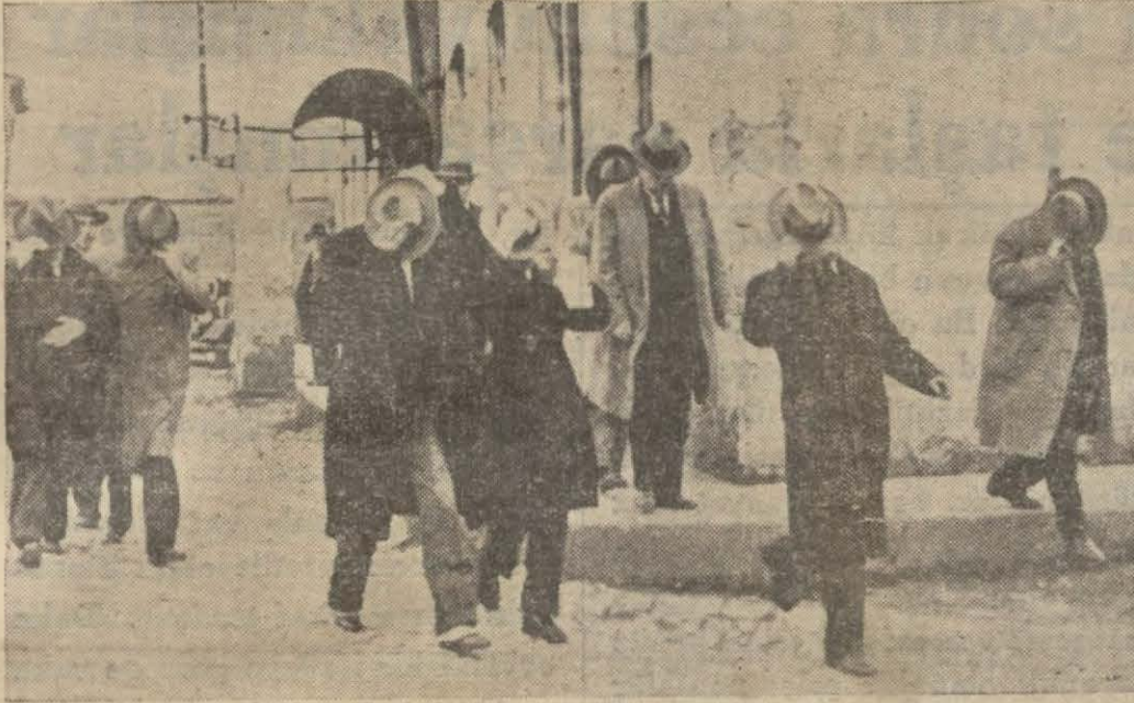
Döviz kaçakçılığı meselesi ehemmiyet kesbetmiş, dün dört kişi tevkif edilmiştir. Bir çok kimseler de zan altındadır. Resmimiz isticvap edilenleri polis dairesinden çıkarken gösteriyor.

[Devamı ikinci sahifede] Necmeddin Sadık