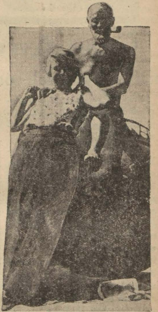
Van Dongen hayranlarından birle birlikte plajda

Van Dongenin salonlarında her memlekettten ve her muhitten elli, altmış kadın ve erkek var. Yeni sinema yapmaya başlamış, pek genç ve pek sarı bir Paris kıızı büfenin önünde davetlilere ikram ediyor. Acaba, bu renkli ve reyihalı bahar çiçeği üstadın kıyımı mı şenlendiriyor? Kim bilir; belki tezatların incizabı... Zaten Van Dongen, güzel kadınların ressamı olduğu kadar dostu ve sevdahısı-