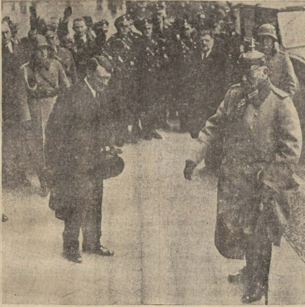
M. Hitler, Alman Reichcumhuru Mareşal Hindenburgun karşısında eğiliyor

Marlenenin yerinde bulunan diğer her hangi bir kadın böyle bir teklifi memnuniyetle kabul eder ve ilk trene binerek Almanya'ya giderdi. Halbuki Marlene teklifi kabul etmemiş, Amerikada artist-