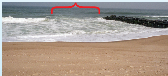
Con frecuencia la corriente marina se origina cerca de estructuras costeras.