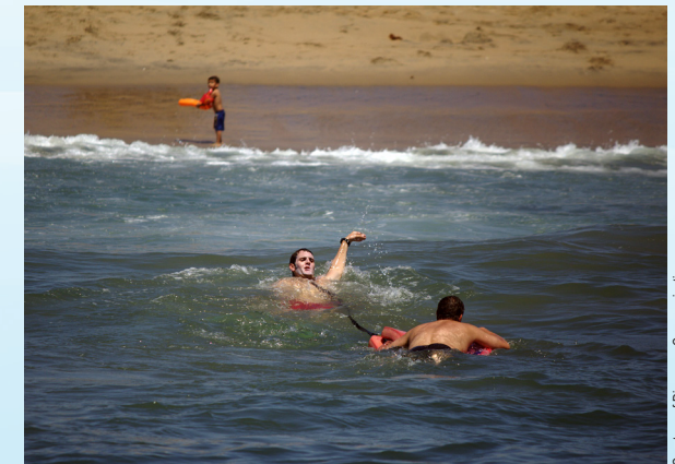
Un salvavidas rescata a un nadador atrapado en la corriente marina.