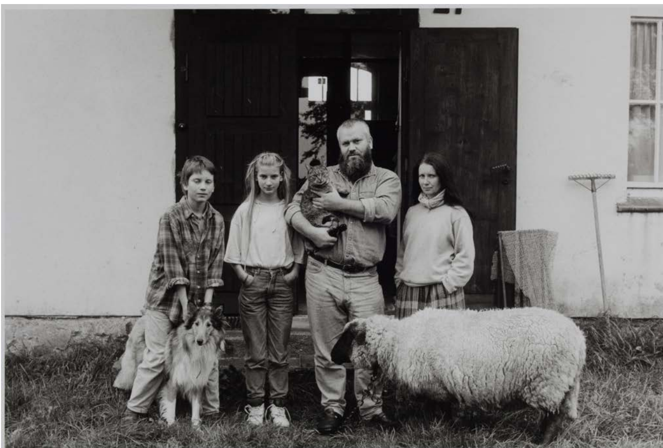
Familie A. (Maler/Grafiker/Fotograf, Grafikerin), Steinhagen-Krummenhagen, 1993