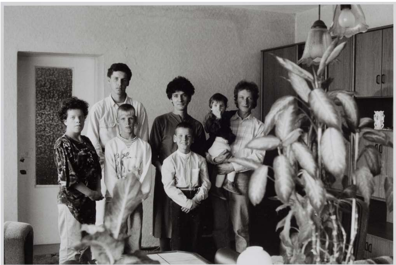
Familie M. (Pflegerin, Maurer), Groß Kiesow 1993