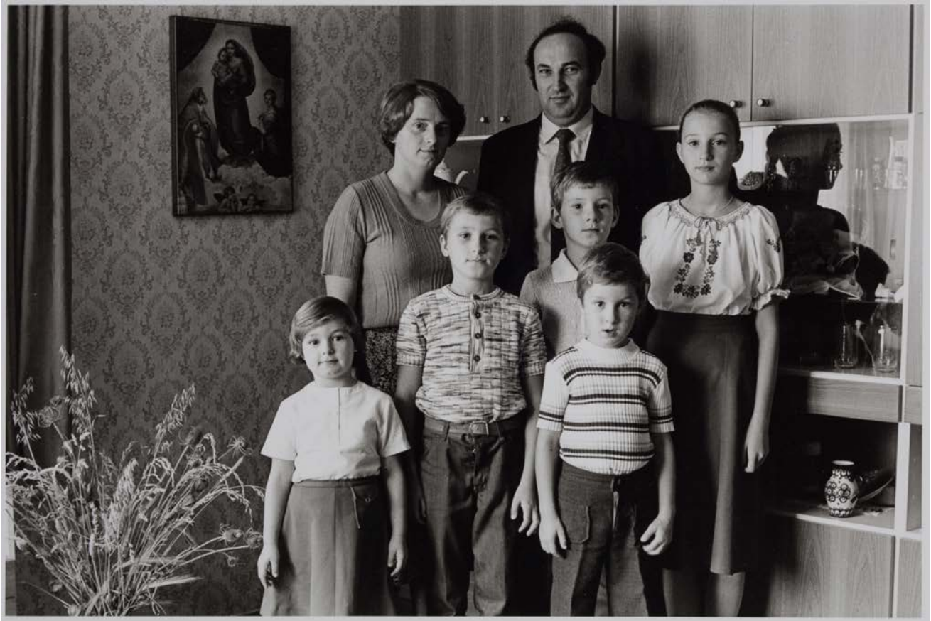
Familie Z. (Lehrerin, Elektroingenieur), Göda-Dreikretscham, 1983