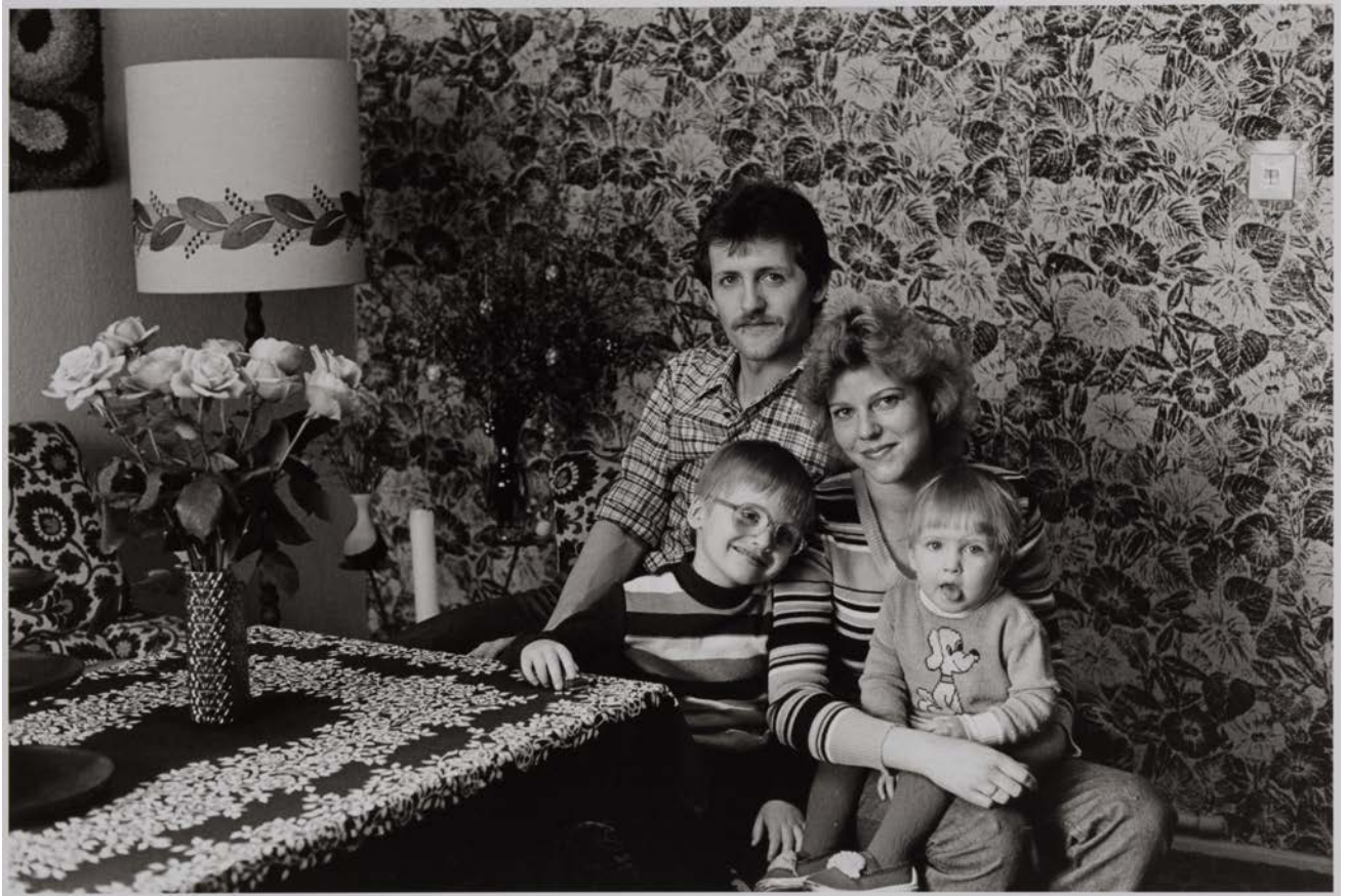
Familie M. (Schlosser, Schriftsetzerin), Berlin-Pankow, 1984