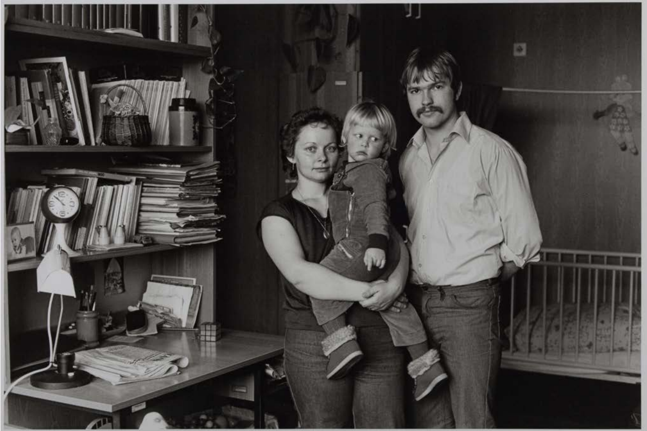
Familie R. (Studentin der Journalistik, Student der Kristallographie), Leipzig, 1983