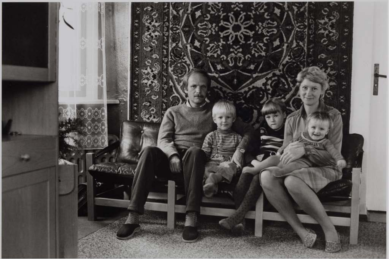
Familie W. (Dipl.-Ing. Wasserwirtschaft, Dipl.-Ökonomin), Stralsund 1983