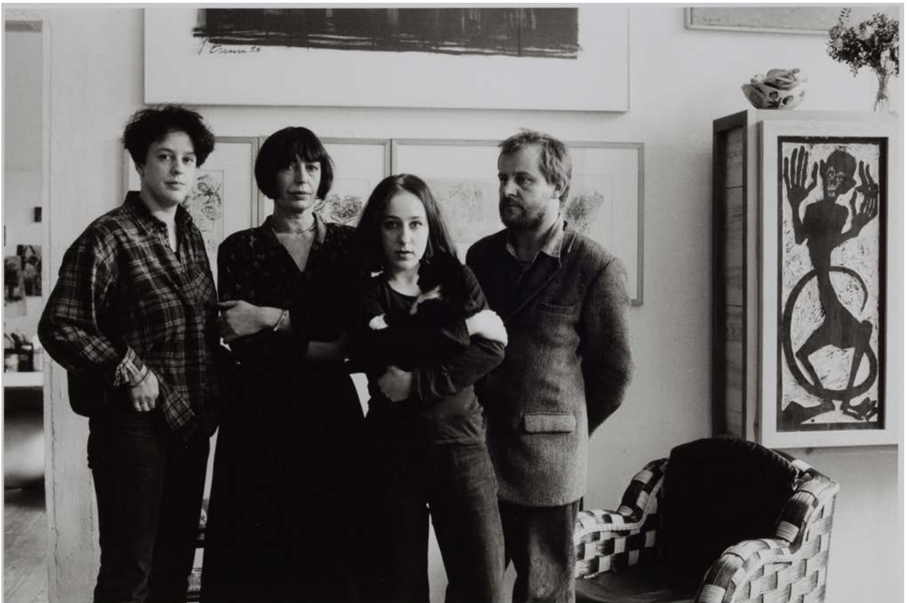
Familie S. (Bühnen- und Kostümbildnerin, Bildhauer) mit Katze in ihrer Wohnung, Berlin-Charlottenburg 1994