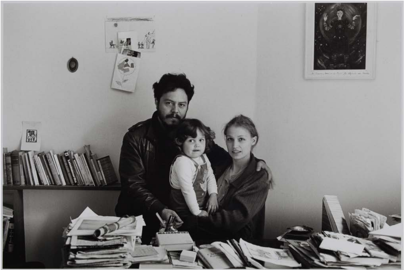
Familie Q./S. (Regisseur, Schauspielerin), Berlin-Friedrichshain,1984