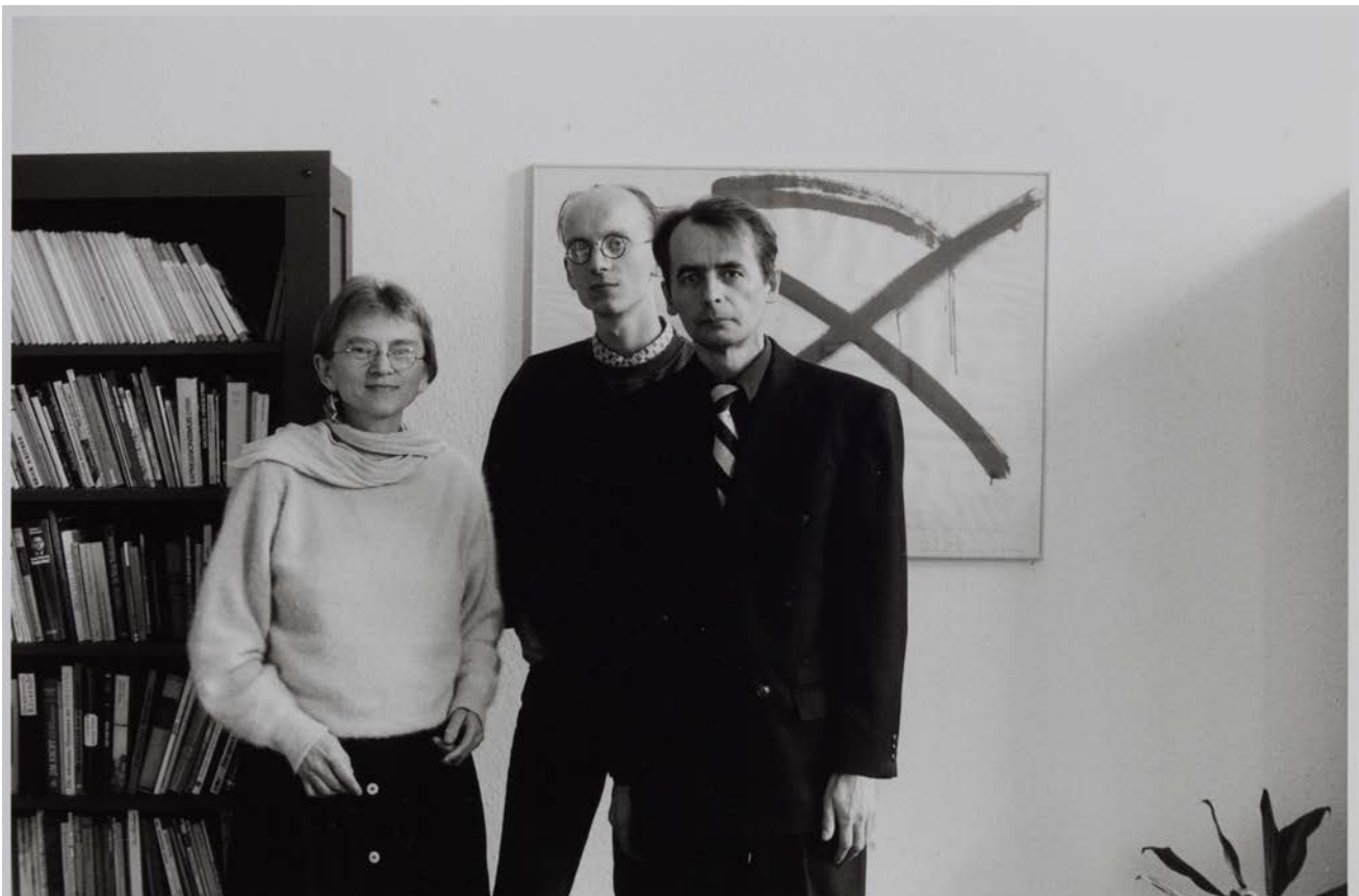
Familie B. (Verwaltungsangestellte, Psychologiestudent, Controller), Köln, 1993