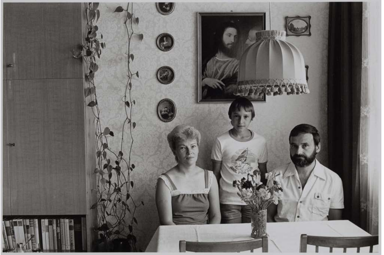
Familie E. (Sachbearbeiterin, Diplom-Film-und-Fernsehwirtschaftler), Dresden, 1983