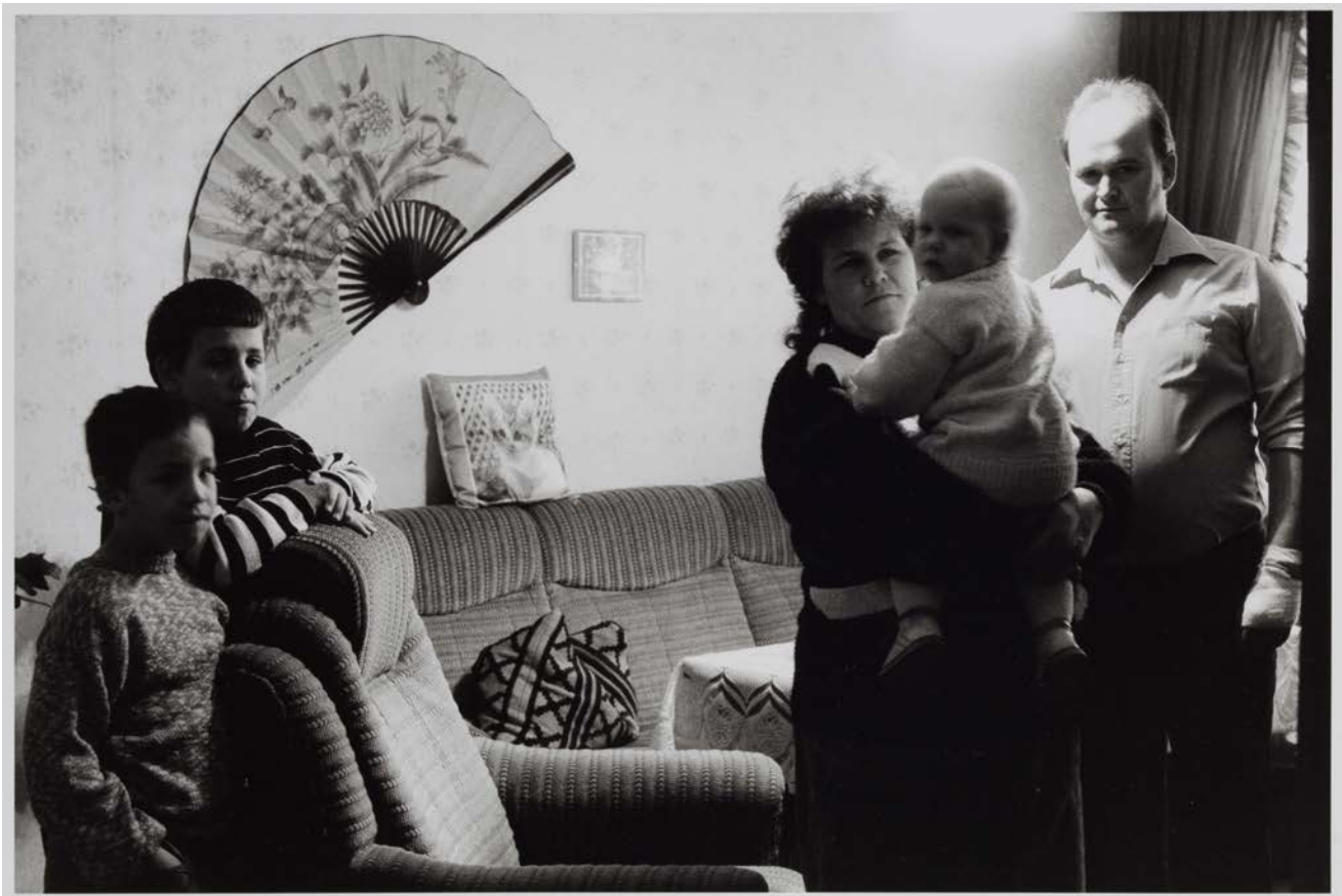
Familie M. (Fleischer/arbeitslos, Ehefrau im Erziehungsjahr), Seelow 1993