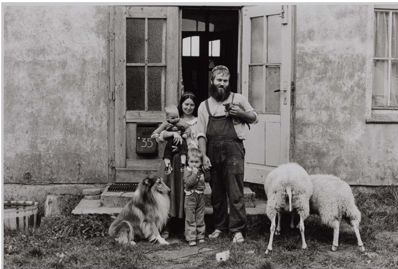
Familie A. (Grafikerin, Maler/Grafiker), Steinhagen-Krummenhagen, 1983