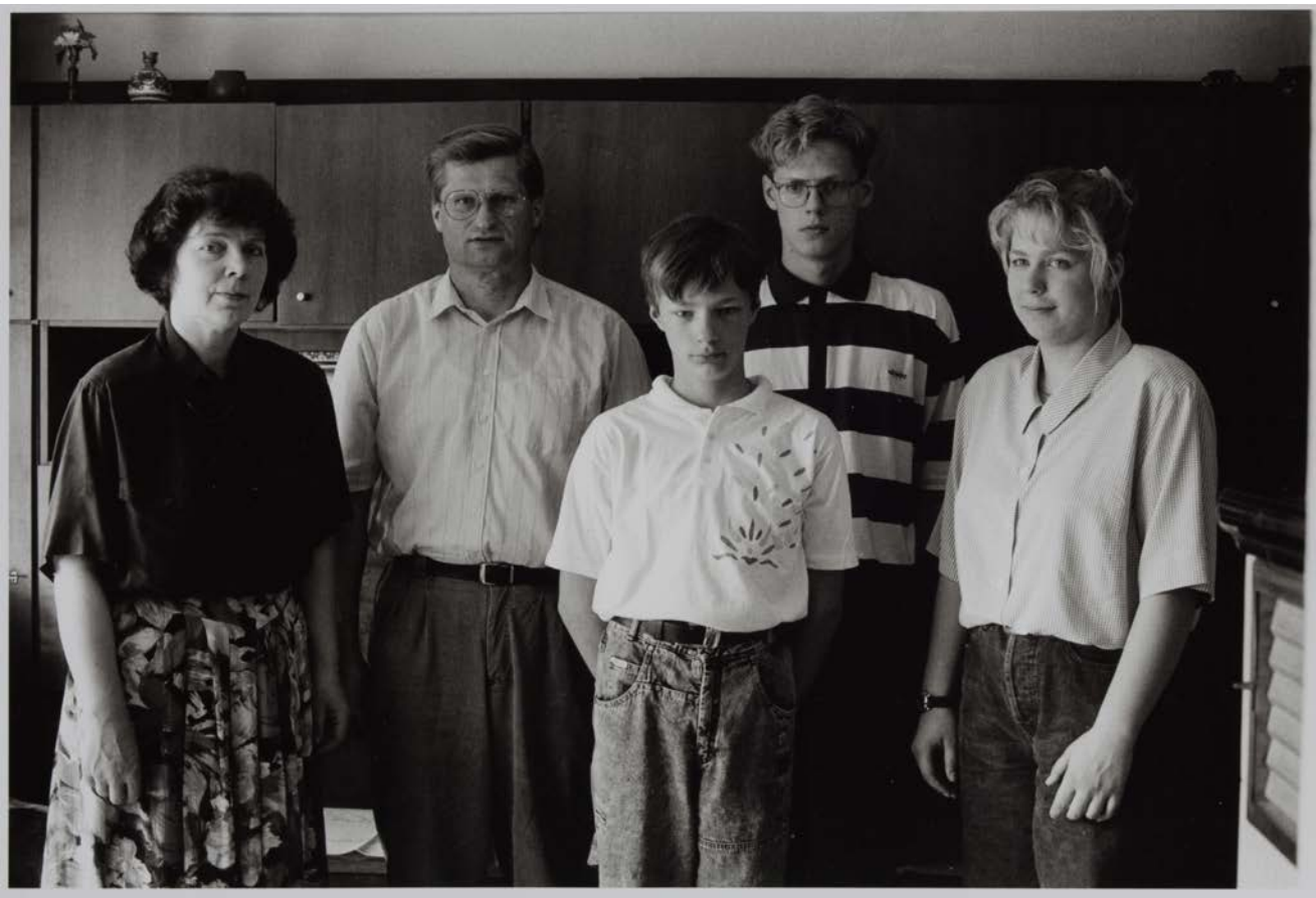
Familie B. (Wirtschaftsleiterin, Kalkulator), Räckelwitz 1993