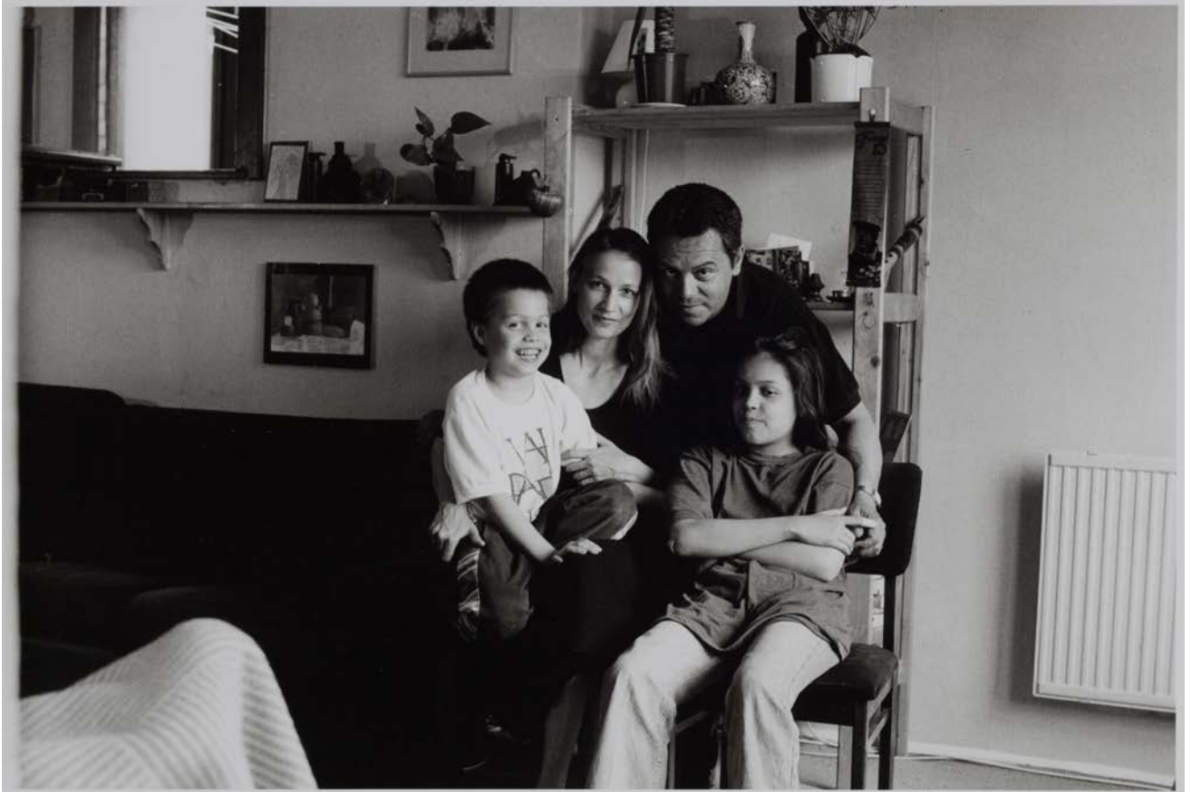
Familie Q./S. (Schauspielerin, Regisseur), Berlin-Friedrichshain,1994