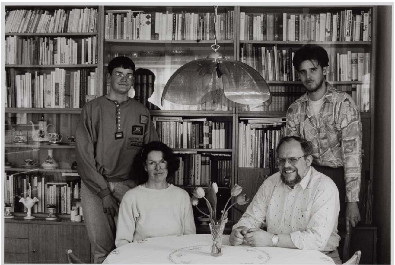
Familie M.-C. (Leiterin Lagerhaltung und Logistik; Leiter Altlasten, Abfall- und Recyclingwirtschaft), Dresden-Trachenberge, 1993