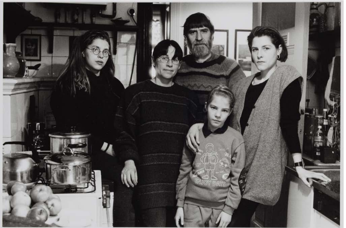
Familie B. (Gartenarchitektin, Grafiker), Berlin-Pankow 1993