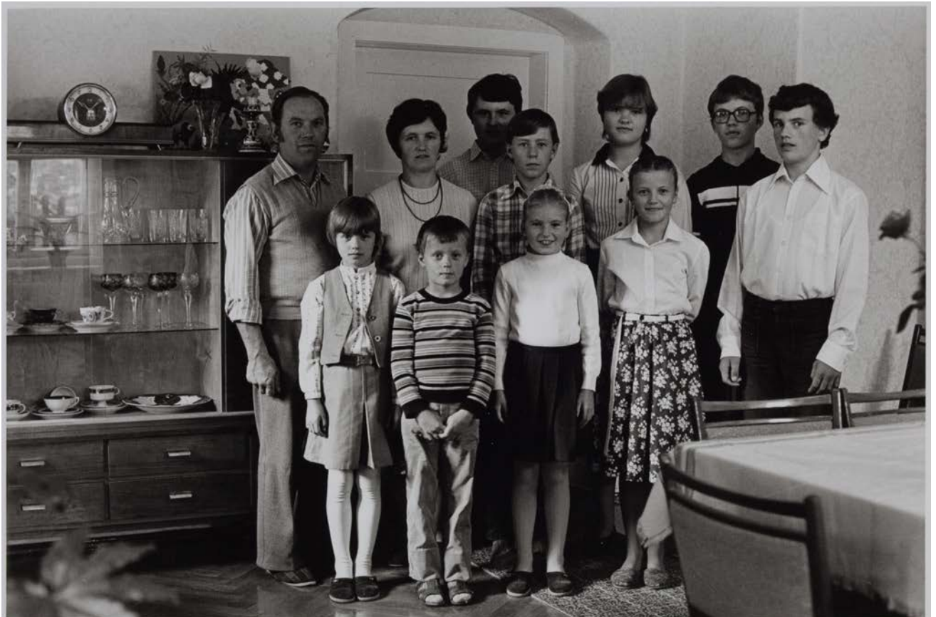
Großfamilie Z. (Landwirt, Hausfrau), Nebelschütz, 1983