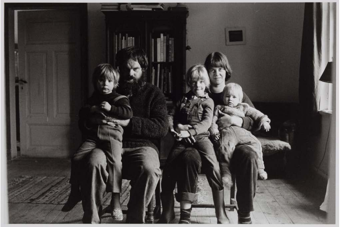
Familie B. (Töpfer), Trent-Jabelitz, 1983