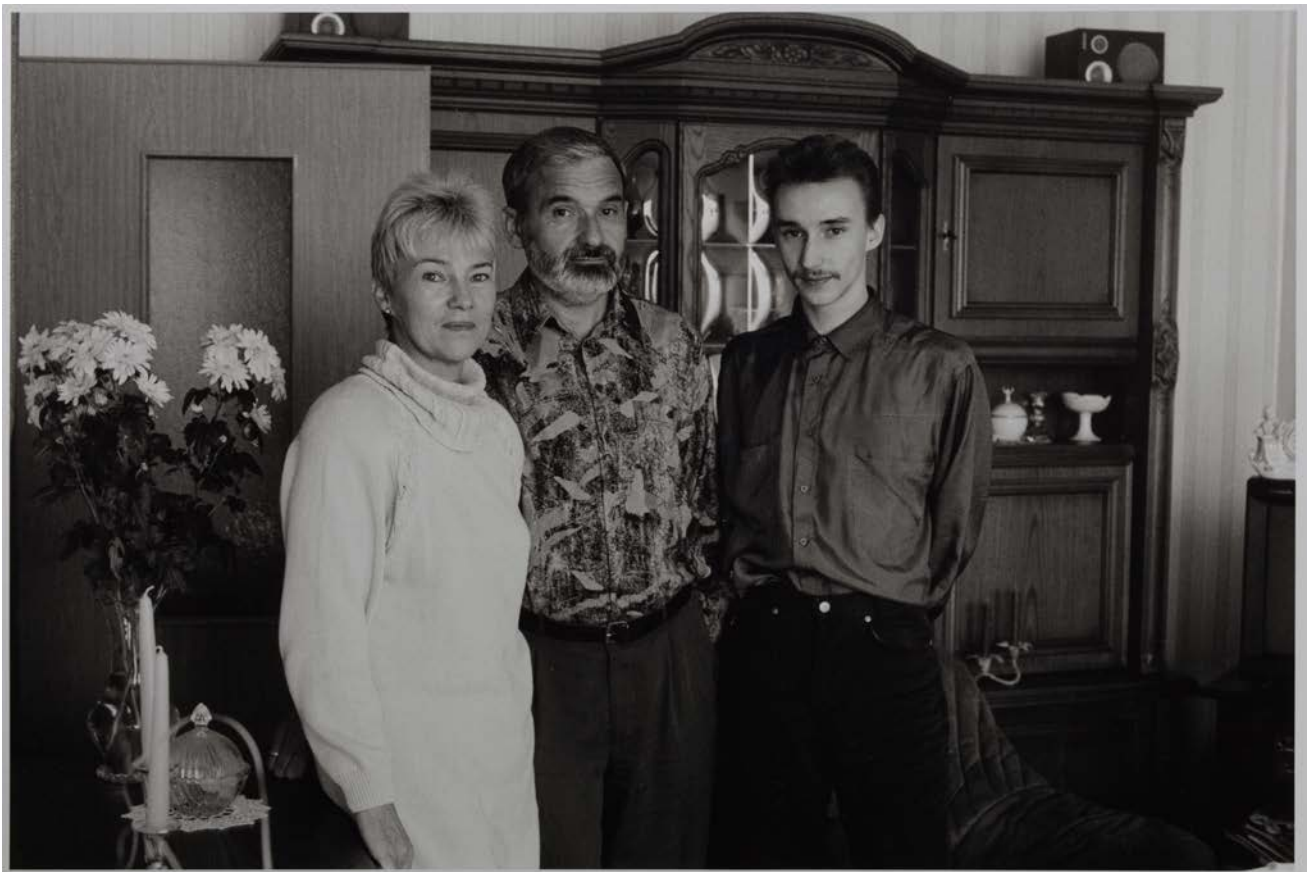
Familie E. (Sachgebietsleiterin, Verwaltungsdirektor Staatsoperette Dresden, Auszubildender zum Industriekaufman), Dresden, 1993