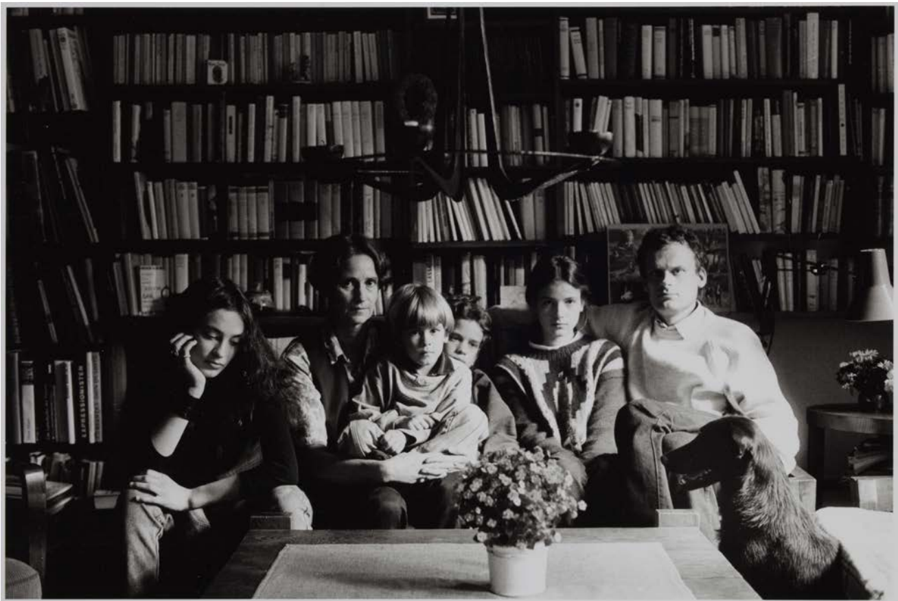
Familie S. (kirchliche Angestellte, Pfarrer), Groß Kiesow, 1993