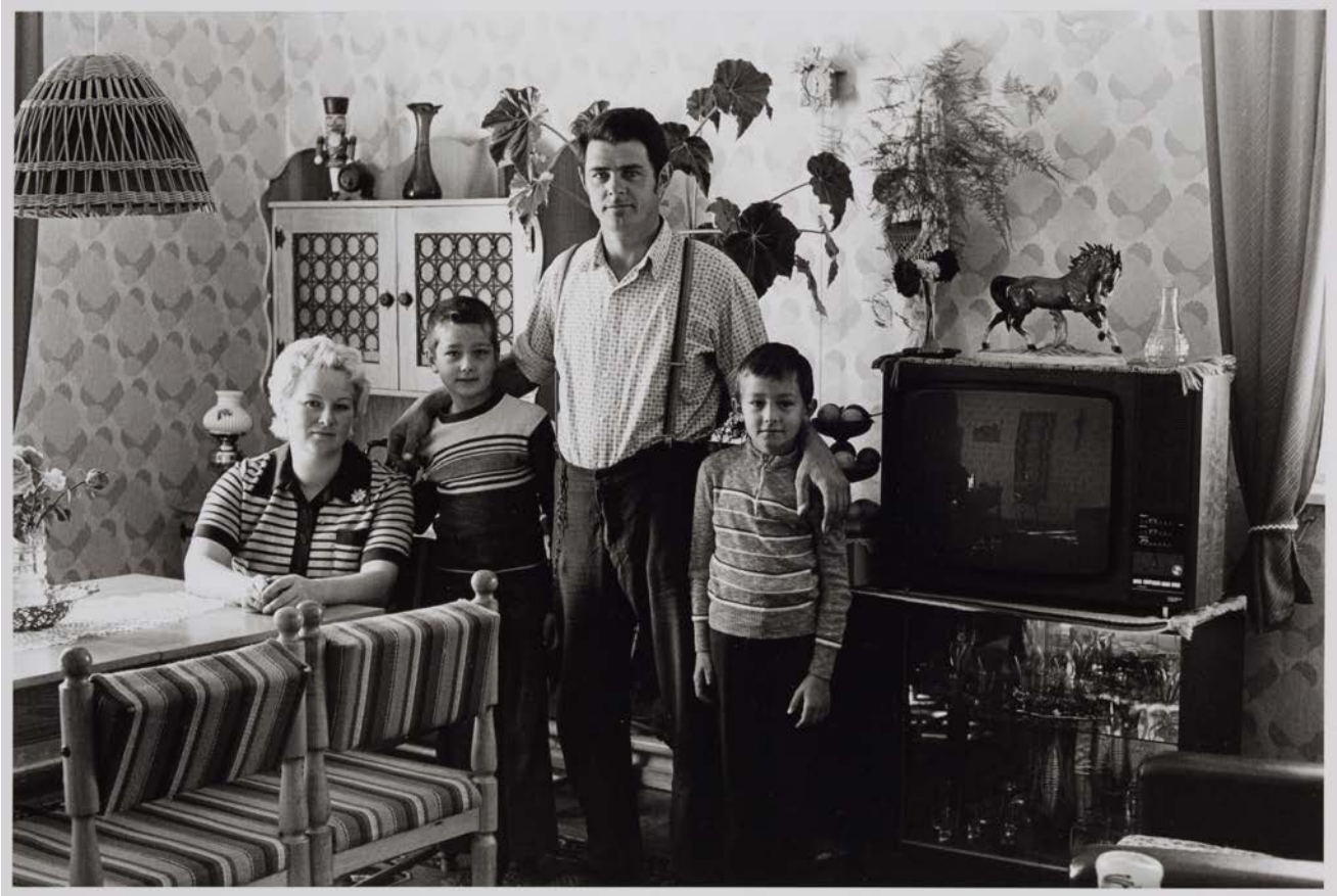
Familie D. (Friseur, Landmaschinenschlosser), Groß Kiesow-Sanz, 1983