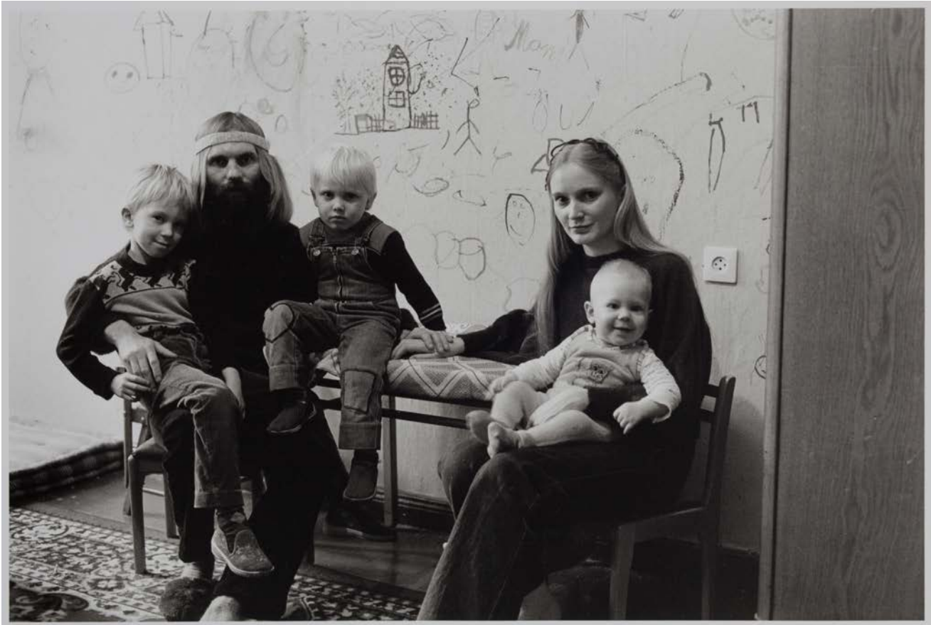
Familie R. (Musiker, Goldschmiedin) in ihrer Wohnung, Berlin-Prenzlauer Berg 1983