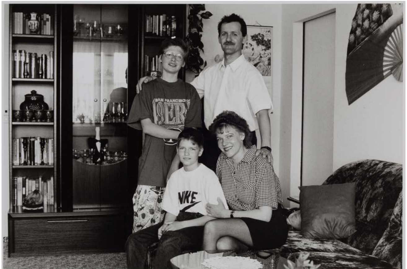
Familie M. (Schlosser, Druckerin), Berlin-Pankow, 1994