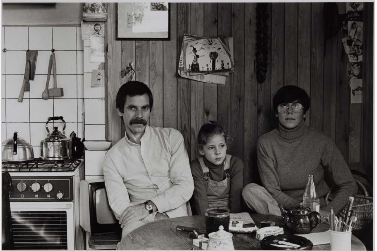
Familie B. (Kinderneuropsychiater, Lektorin), Berlin-Pankow, 1984