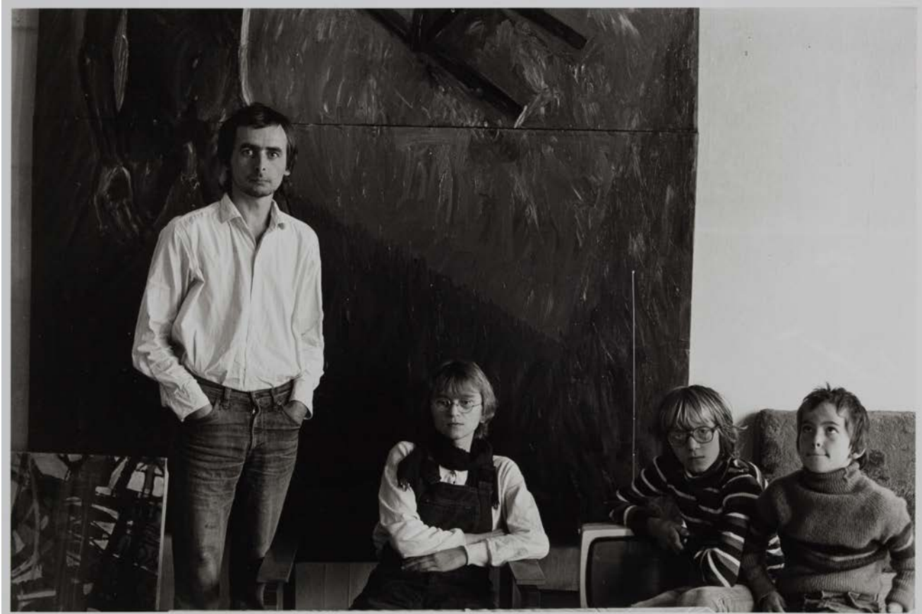
Familie B. (Mathematiker/Fotograf und Hilfsarbeiter, Sachbearbeiterin) in ihrer Wohnzimmergalerie, Magdeburg, 1983