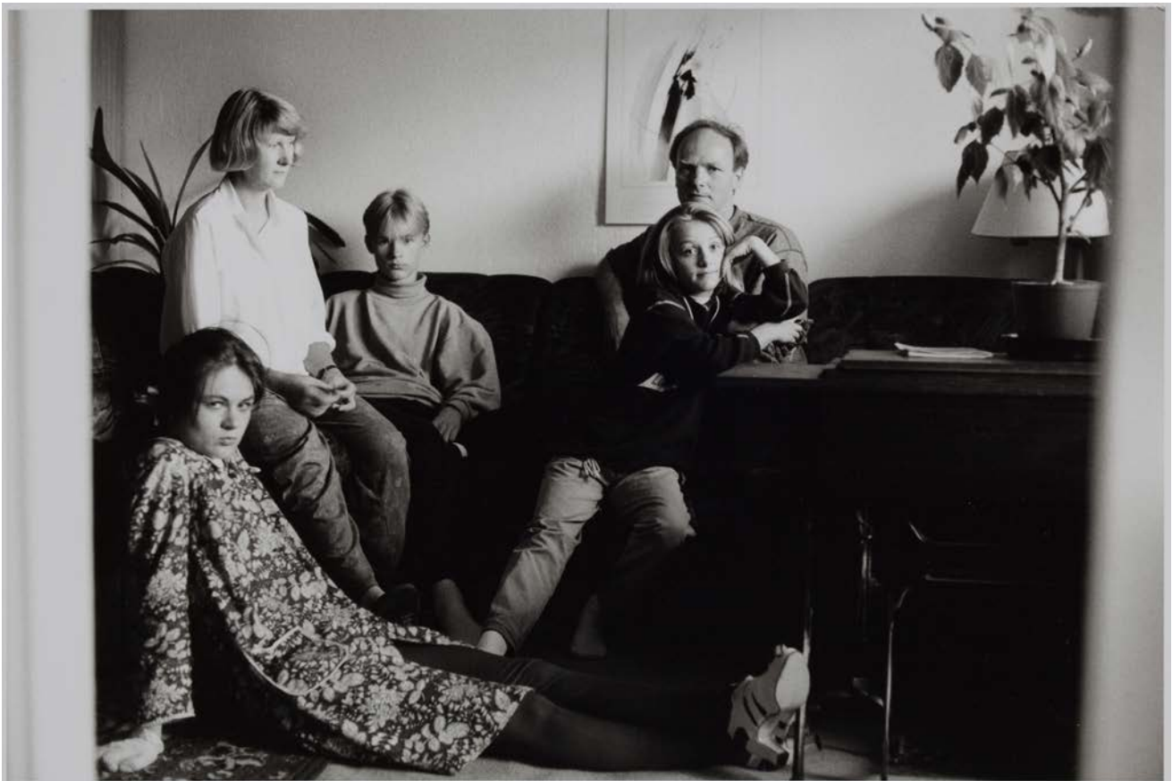
Familie W. (Abteilungsleiter Wasserwirtschaft, Ehefrau arbeitslos), Stralsund 1993