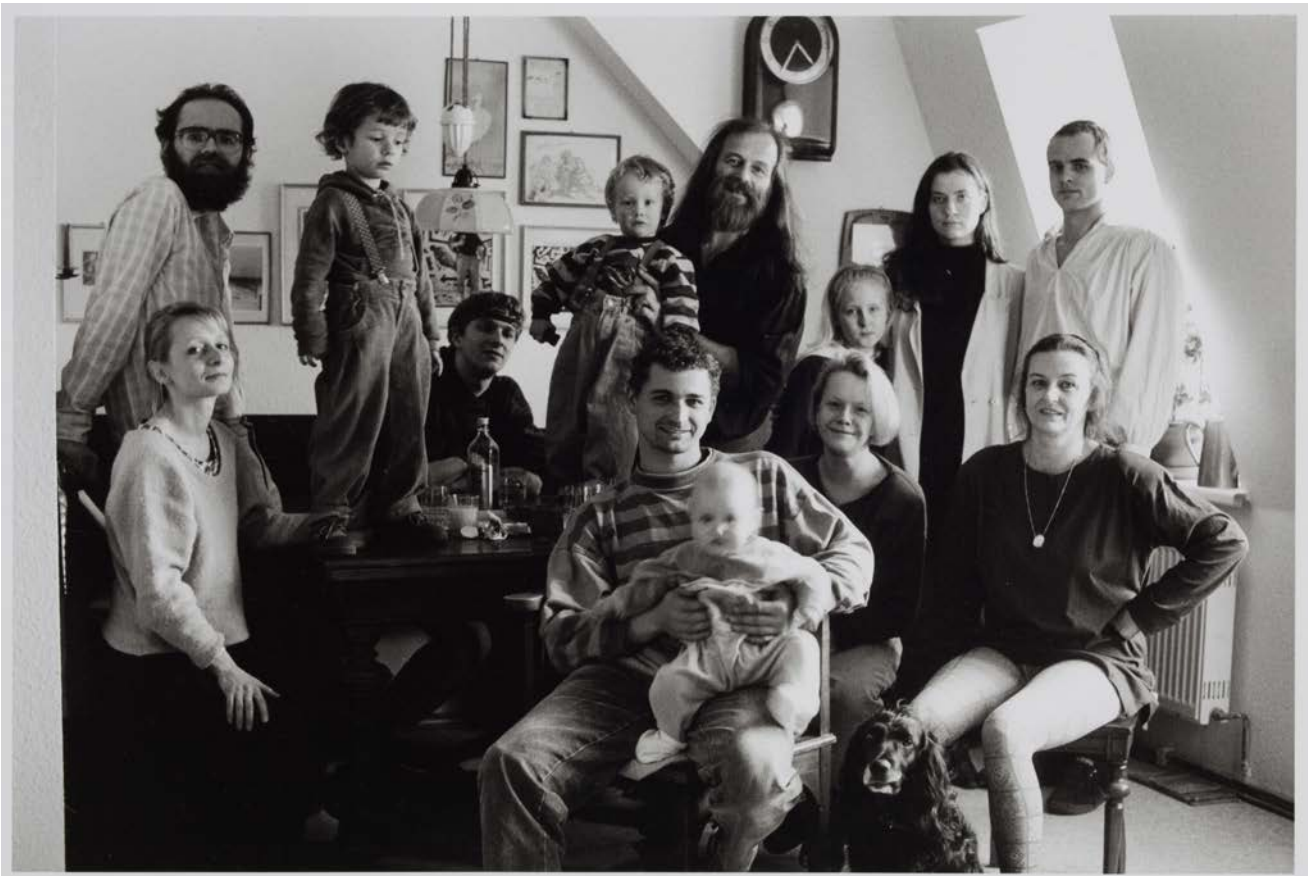
Großfamilie T./F. (Journalist, Hausfrau), Dresden 1993