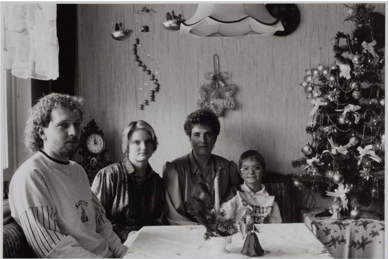
Familie M. (Frau M. Krankenschwester, Tochter Krankenschwesterlehrling, Sohn Berufskraftfahrer), Dresden 1993