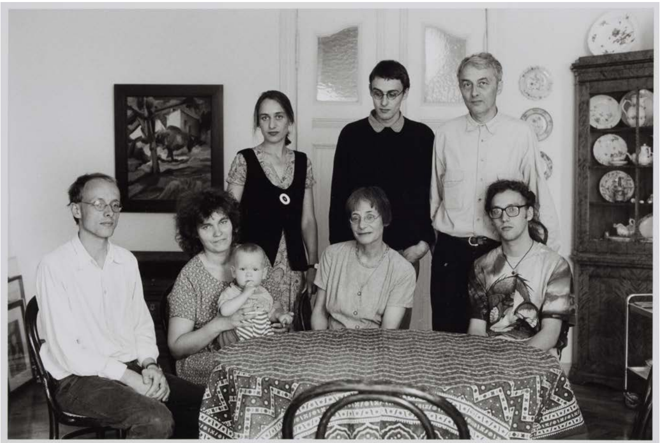
Großfamilie E. (Ärztin, Archäologe), Berlin-Pankow, 1993