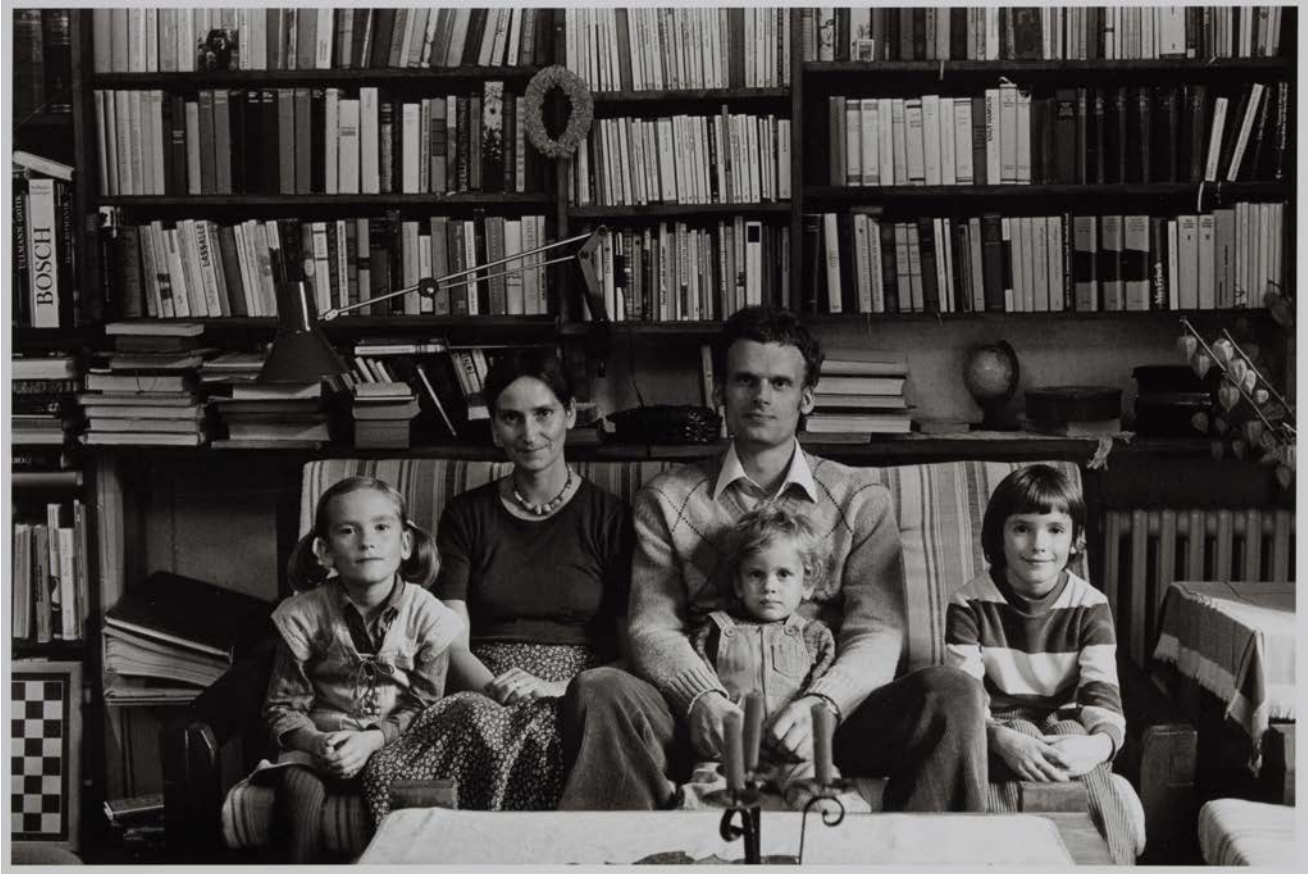
Familie S. (Biologin/Hausfrau, Pfarrer), Groß Kiesow 1983