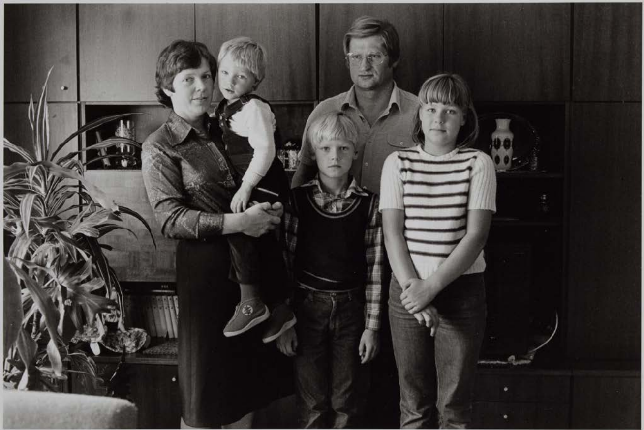
Familie B. (Stenotypistin, Bauwirtschaftler), Räckelwitz, 1983