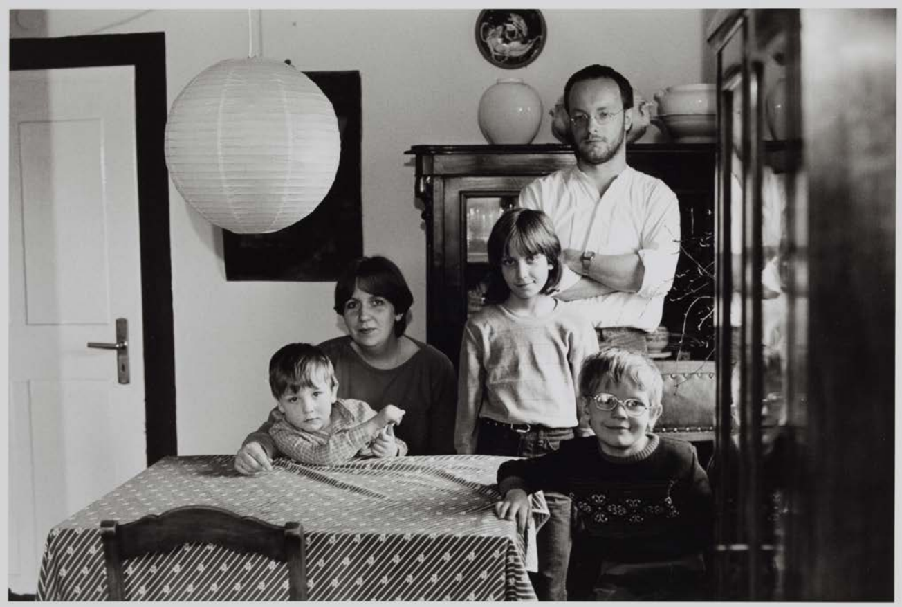
Familie W. (Pädagogische Betreuerin, Mitarbeiter beim Dresdner An- und Verkauf), Dresden-Pillnitz, 1987