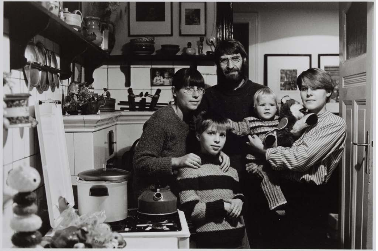
Familie B. (Grafiker, Gartenarchitektin), Berlin-Pankow 1984