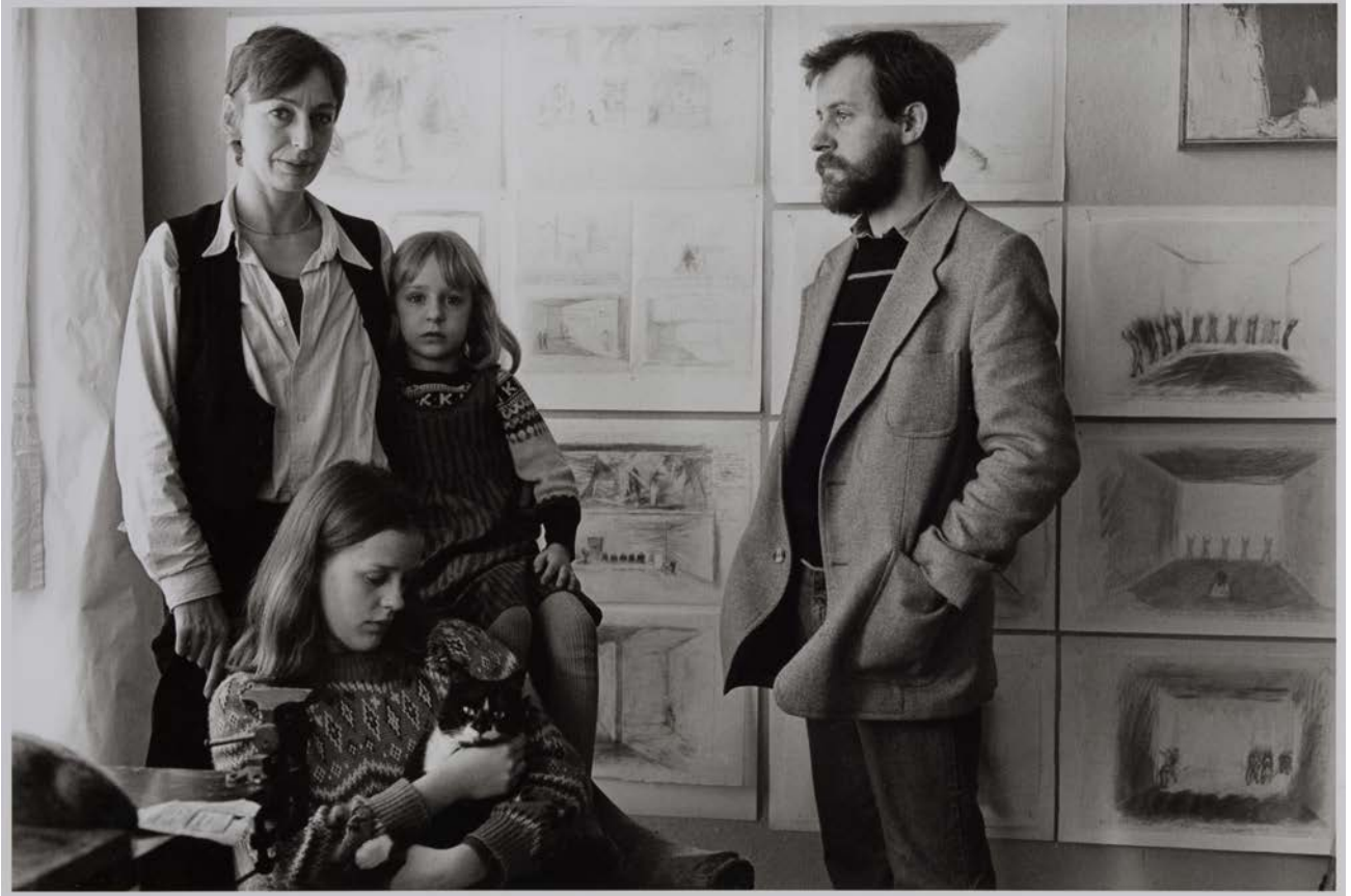
Familie S. (Bühnen- und Kostümbildnerin, Bildhauer), Berlin-Prenzlauer Berg 1984