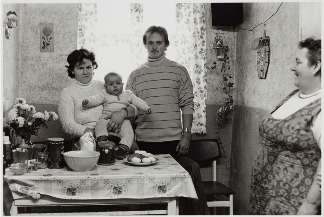
Familie M./T. (Fleischerin, Fleischer), Kienitz, 1983