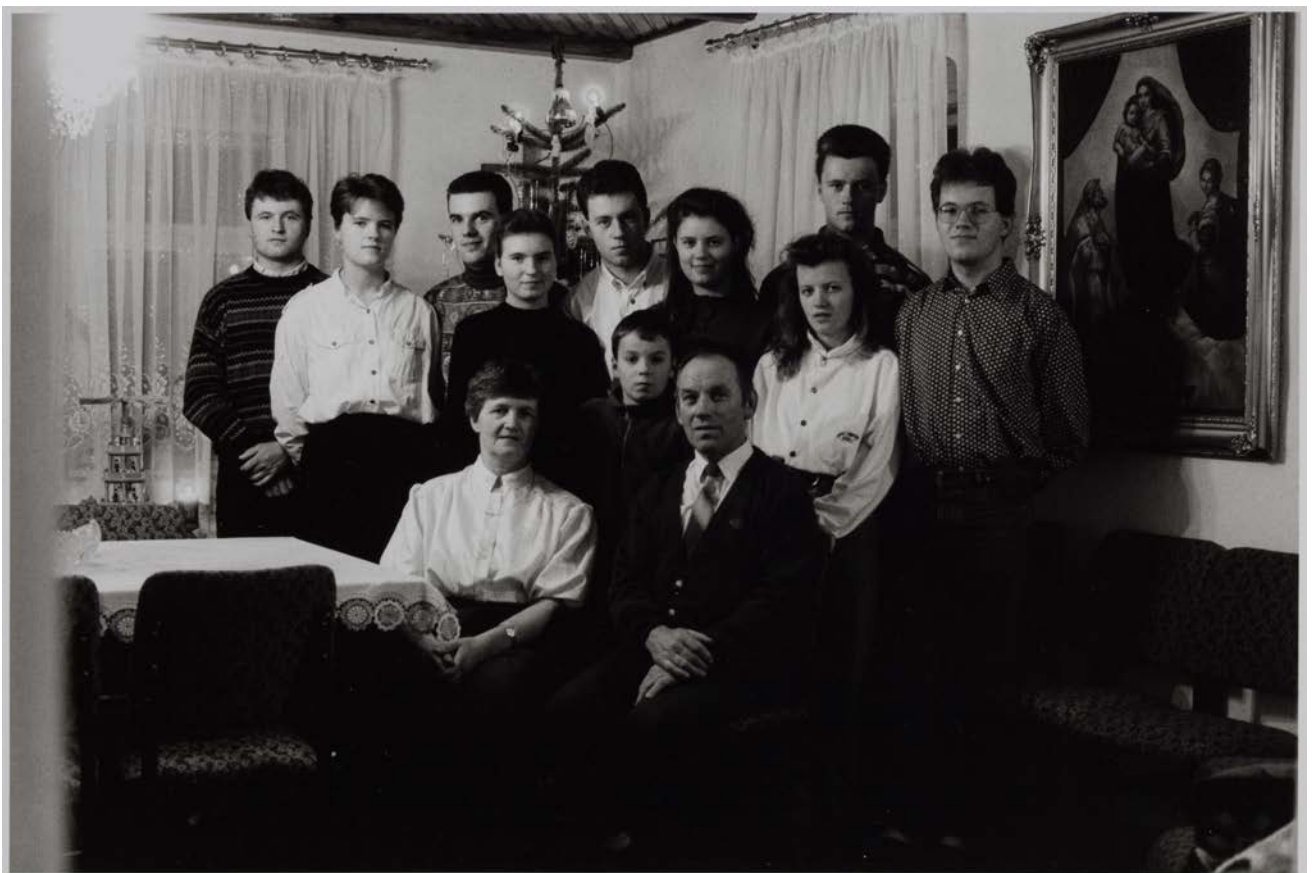
Großfamilie Z. (Hausfrau, Landwirt), Nebelschütz, 1993