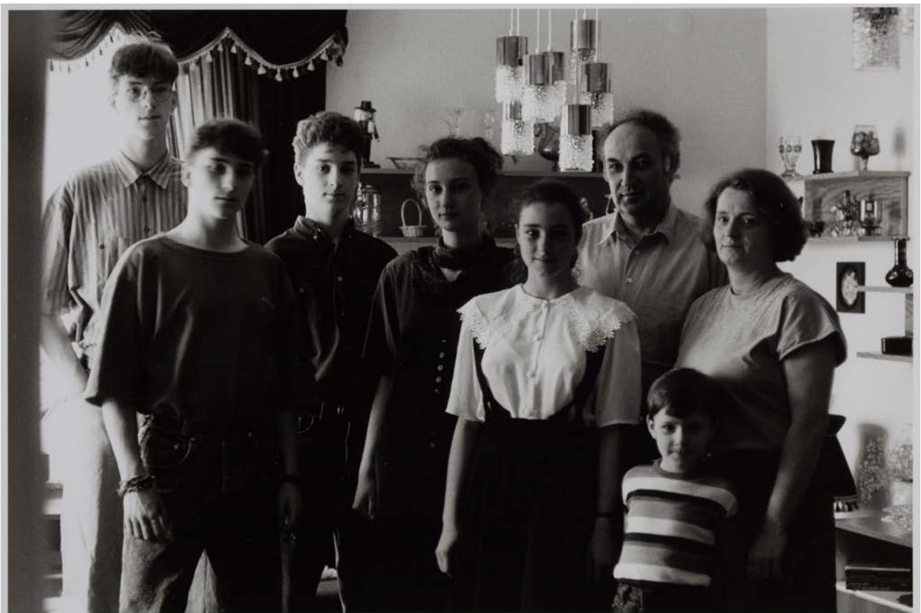
Familie Z. (Elektroingenieur, Lehrerin), Göda-Dreikretscham, 1993