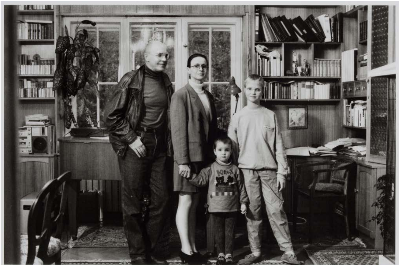
Familie W. (Komponist, Fachärztin), Berlin-Köpenick 1993