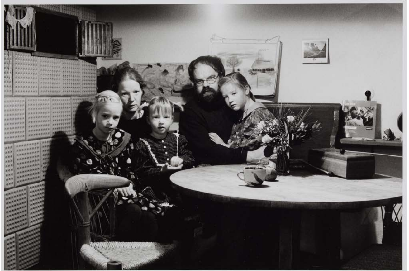
Familie B./K. (Töpfer), Trent-Jabelitz 1993