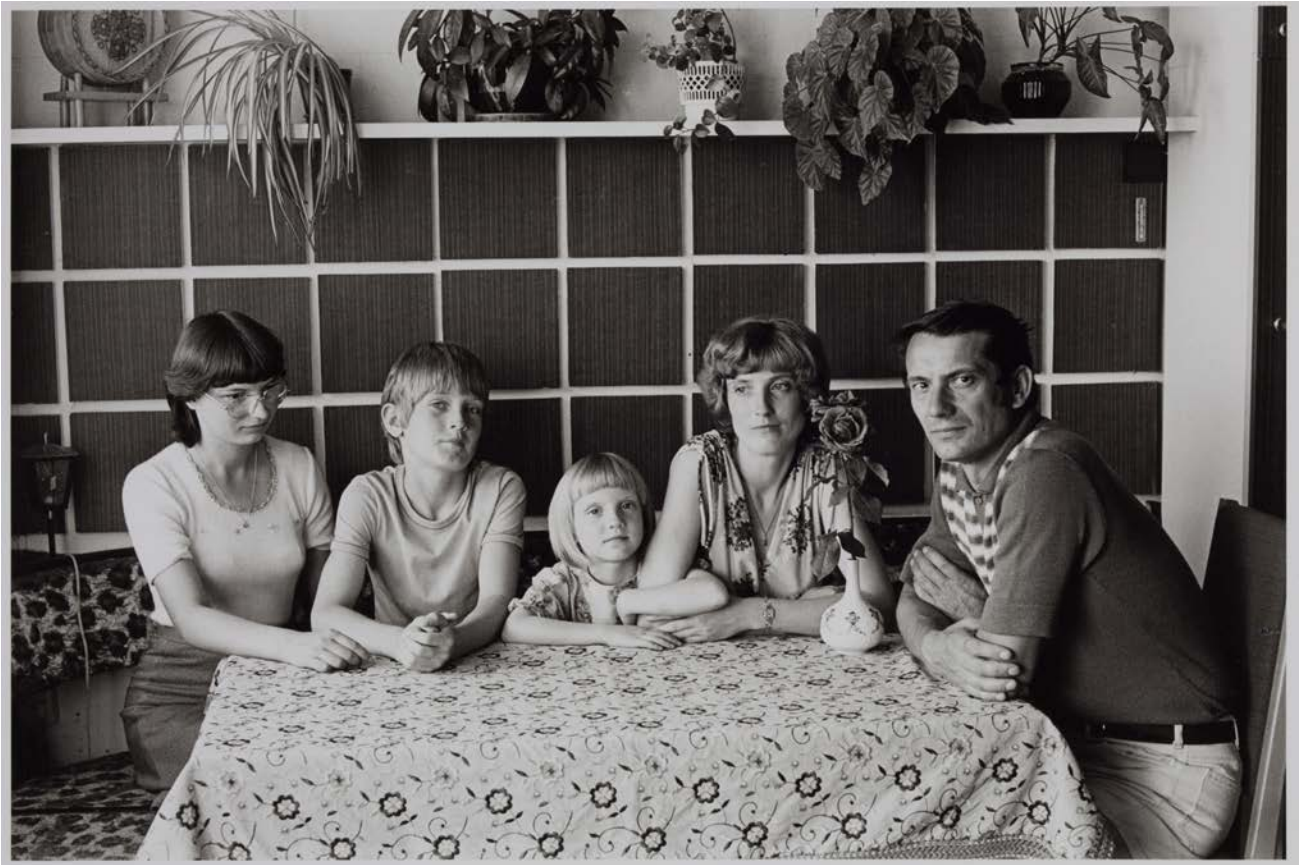
Familie M. (Meister für Betriebs-, Meß-, Steuer-, und Regeltechnik, Rechnungslegerin) Dresden, 1983