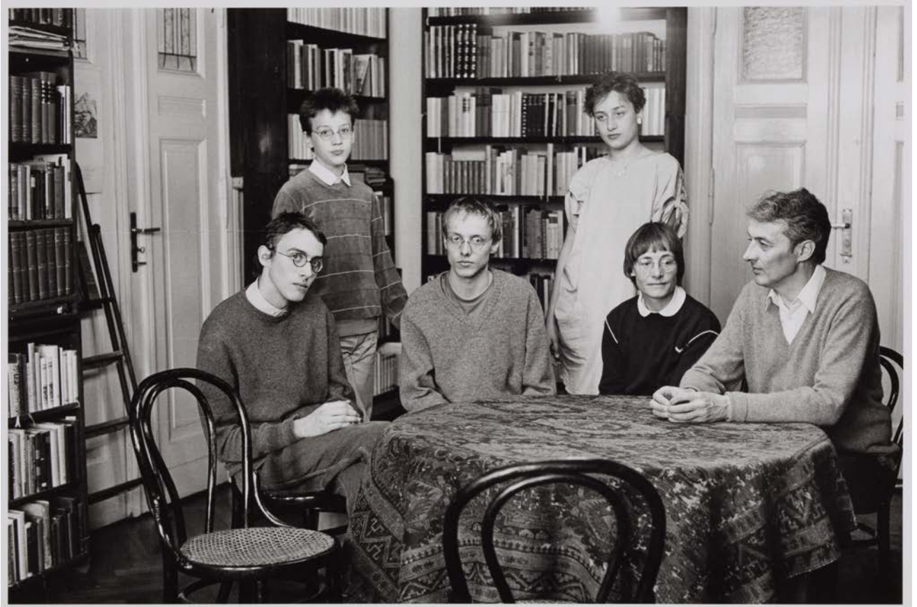
Familie E. (Ärztin, Archäologe), Berlin-Pankow, 1985