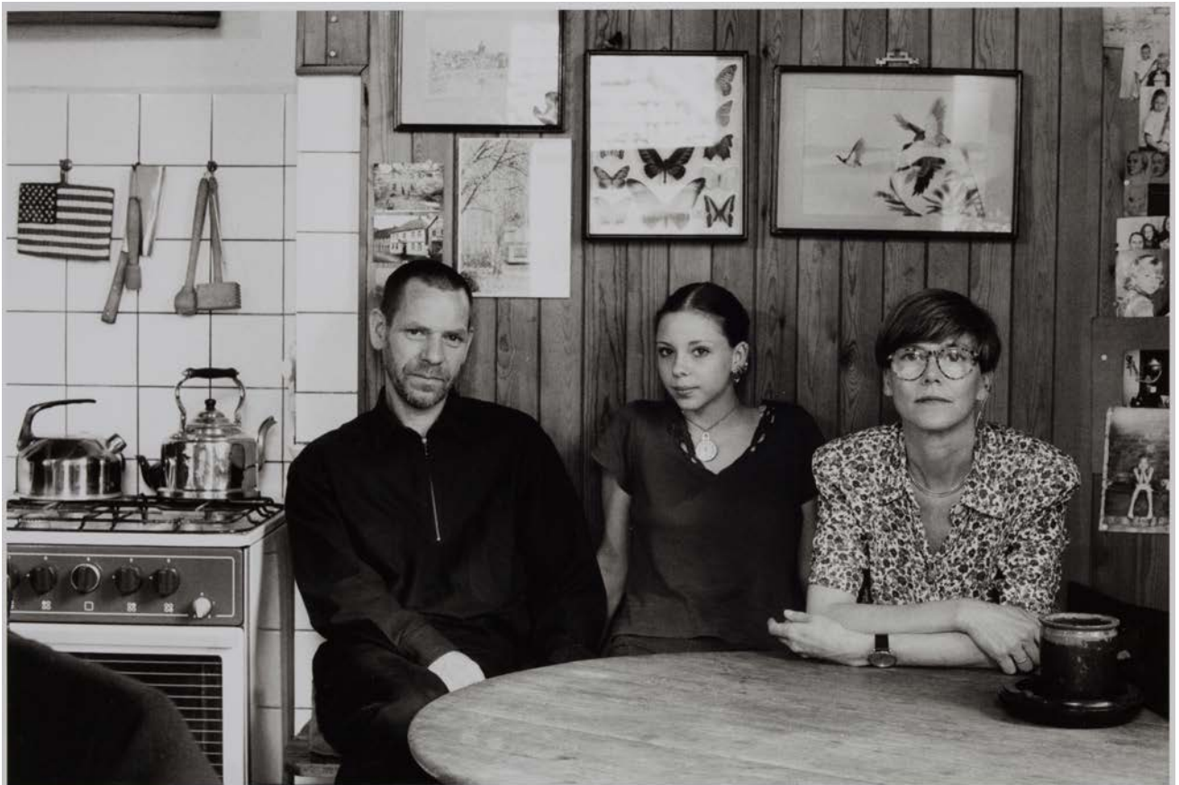
Familie B. (Facharzt für Kinder- und Jugendpsychiatrie, Ehefrau in Weiterbildung zur Europasekretärin), Berlin-Pankow 1994