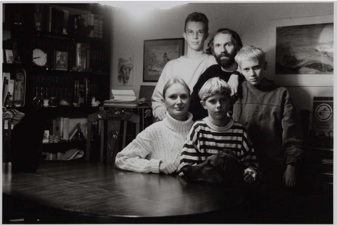
Familie R. (Goldschmiedemeisterin, Schornsteinfeger, Berlin-Reinickendorf, 1993