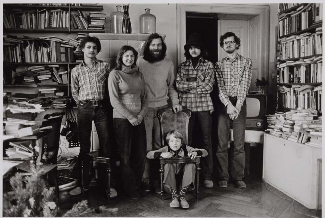
Familie T./F. (Energetiker, Kantinenleiterin), Dresden-Neustadt 1982