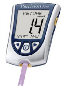
Blood ketone meter