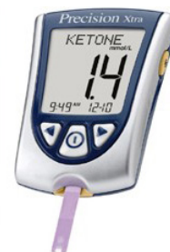
የደም ኪቶን ቆጣሪ